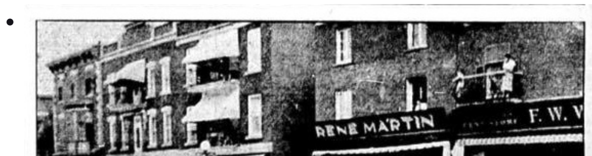
La librairie Martin en 1937